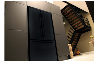
IWO19JSPF BIK 3BM-DBM

Vlakke inbouw Incl. BIK inbouwframe Mat zwart RAL 9005 rechte hoeken 'Design' grepen in mat zwart