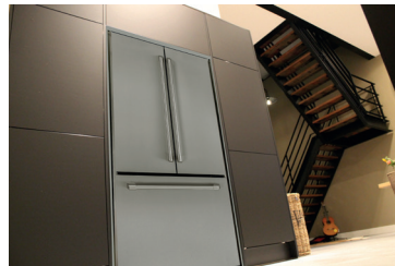
IWO19JSPF BIK 30

Vlakke inbouw Incl. BIK inbouwframe Inox (rvs) Rechte hoeken 'Café' grepen in inox (rvs)